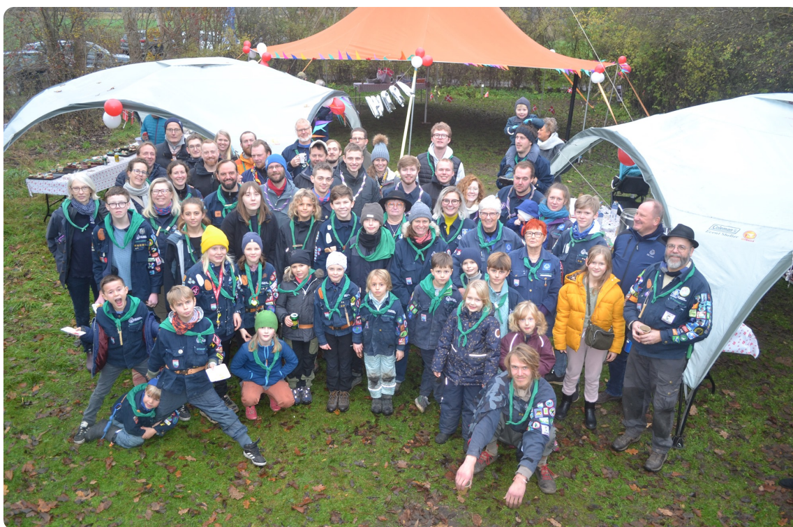
Gruppefoto af De Vilde Svaner - Nivå taget ved spejderhytten på Møllevvej den 9. november 2019 i forbindelse med fejring af gruppens 50-års jubilæum. a